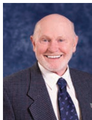
André Paré District 2 Chemin du Roy